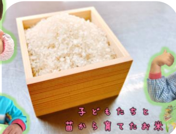
子どもたちと 苗から育てたお米